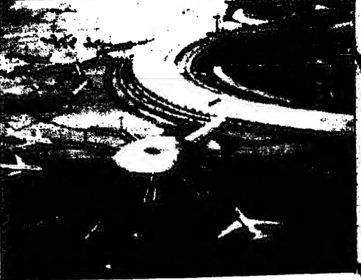
رسم تخيلي للمخططات الجديدة التي ستطرح في مطار ابو ظبي الذي يجري بناؤها حاليا

دعم مساعي تطوير مطار ابو ظبي الذي يجري بناؤها حاليا، وذلك في تقريره الصادر في 17 كانون الأول 1997. وكانت المصارف الثلاثة من بين المصارف التي اقرتها الوكالة في تقريرها الصادر في 17 كانون الأول 1997. وبحسب التقرير الصادر في 17 كانون الأول 1997، فقد خفضت موديز تصنيفها لثلاثة مصارف سعودية، وذلك في تقريرها الصادر في 17 كانون الأول 1997.